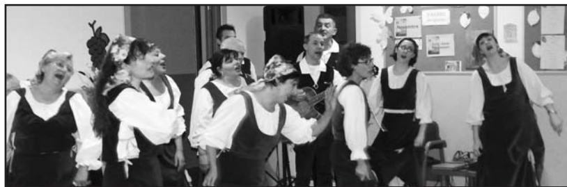
Un momento dell'esibizione del Cafè di Piöcc.

CENTRO DI IGIENE ORALE E PREVENZIONE Studio associato