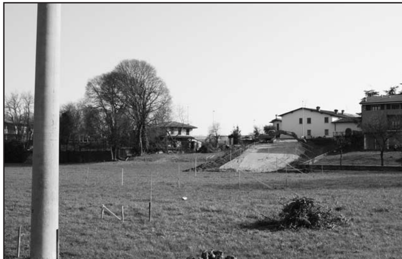
Lavori in corso per il nuovo raccordo stradale fra via Fracassino e via Cerlongo.